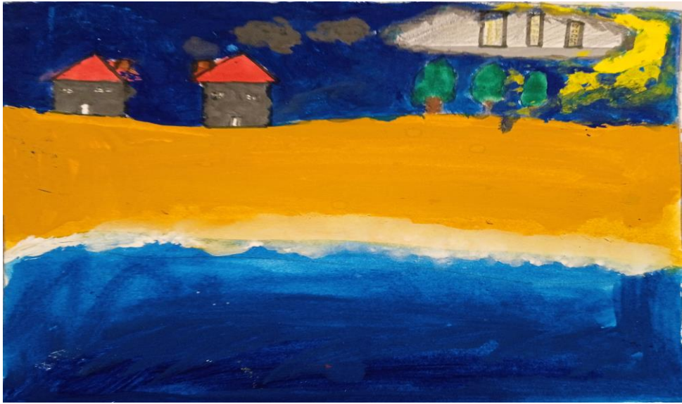
Γιώργος Καφεντζόπουλος, Α3. "Σκοτεινιάζει"